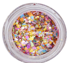
PÓ DE UNICÓRNIO